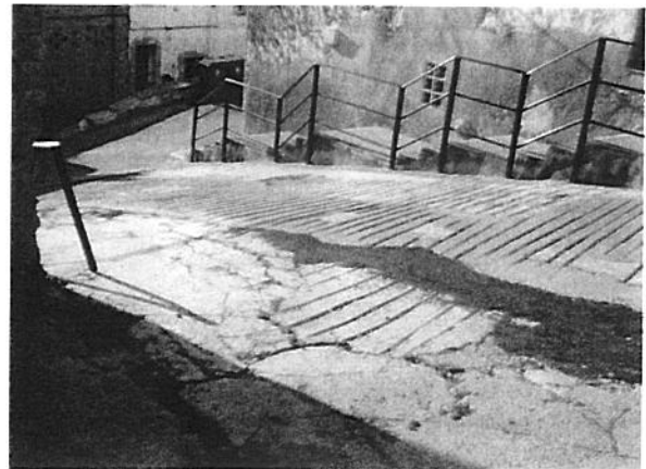
SUBIDA CALLE CALVARIO