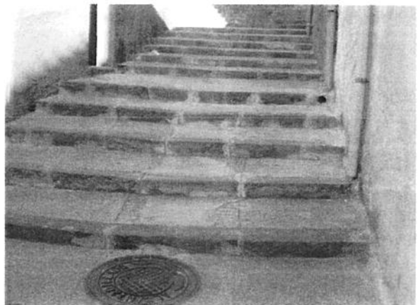
ESCALERAS ENTRE CALLE VALENCIA Y CALLE LA BALMA